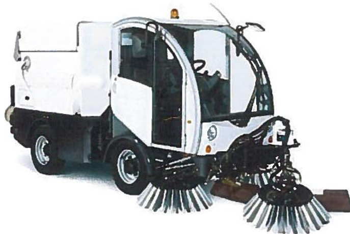
BUCHER City Cat 2020